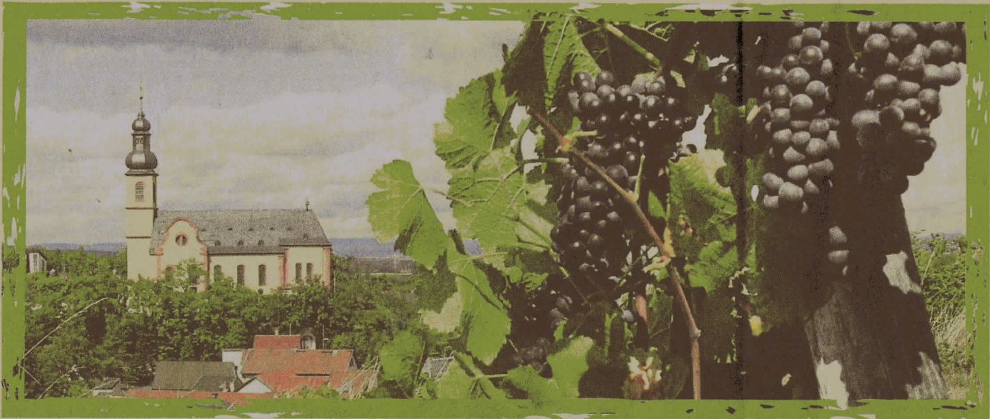
Blick auf die katholische Kirche St. Gerion.