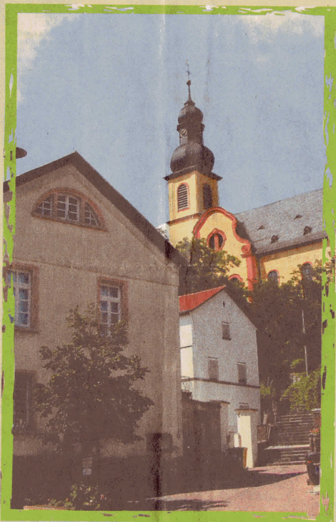
Nackenheim lädt zum Kirchweihfest.